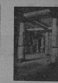
El vestíbulo del Teatro, que se encontraba artísticamente decorado para la fiesta de anoche